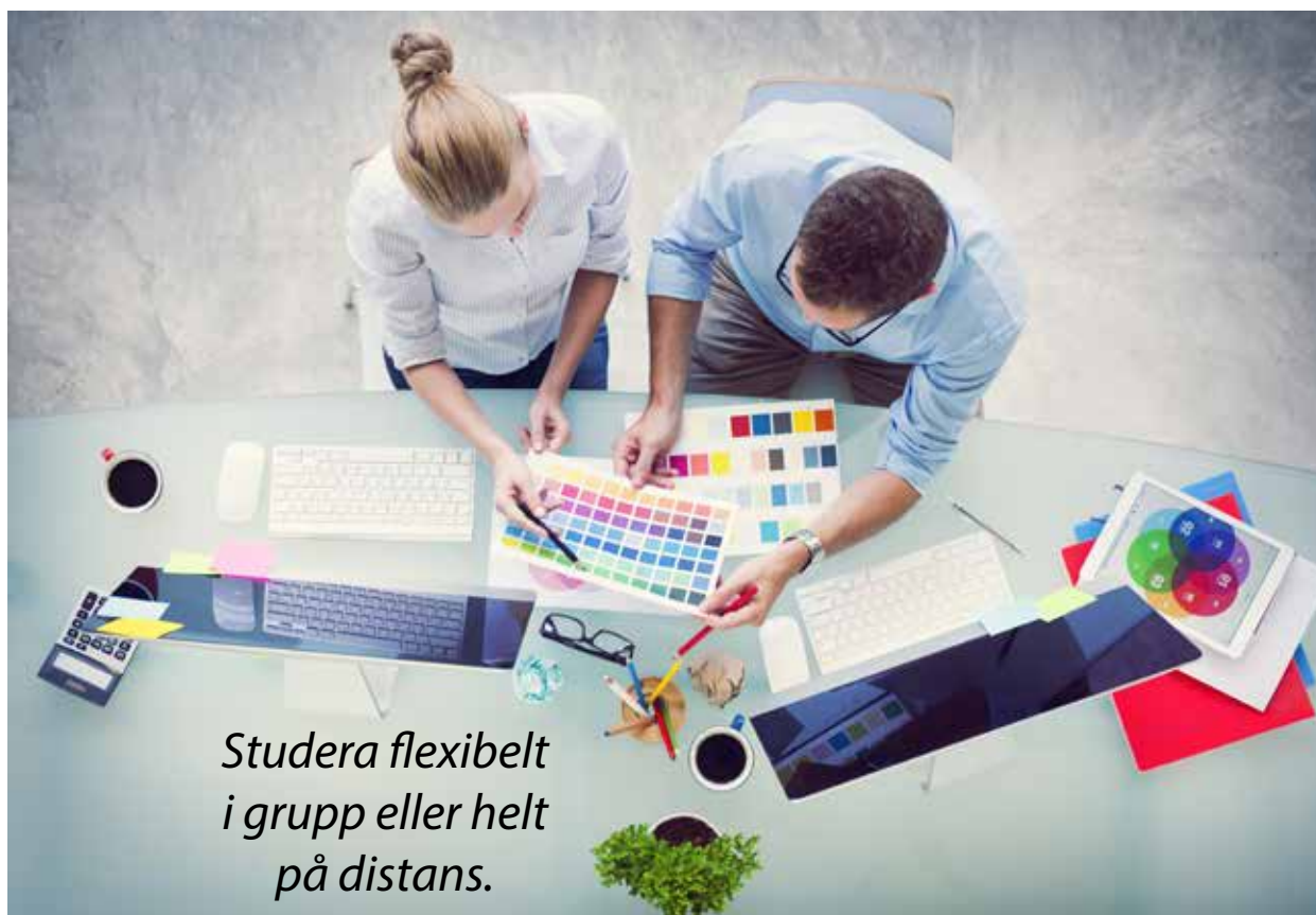
foto grafik media & ekonomi